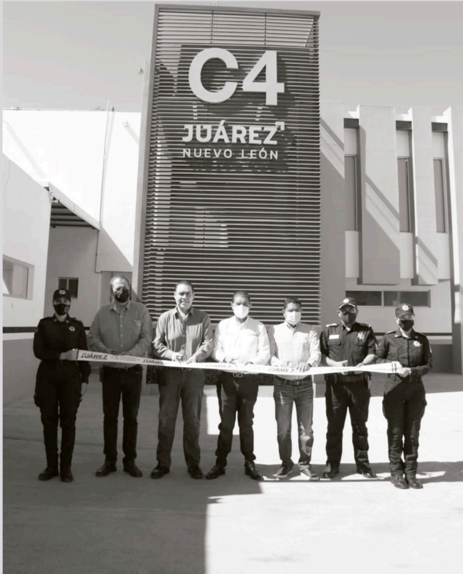
Inauguran el C4.

“No escatimaremos esfuerzos ni recursos para seguir creciendo e innovando nuestras instalaciones de Seguridad Pública y así brindarte la