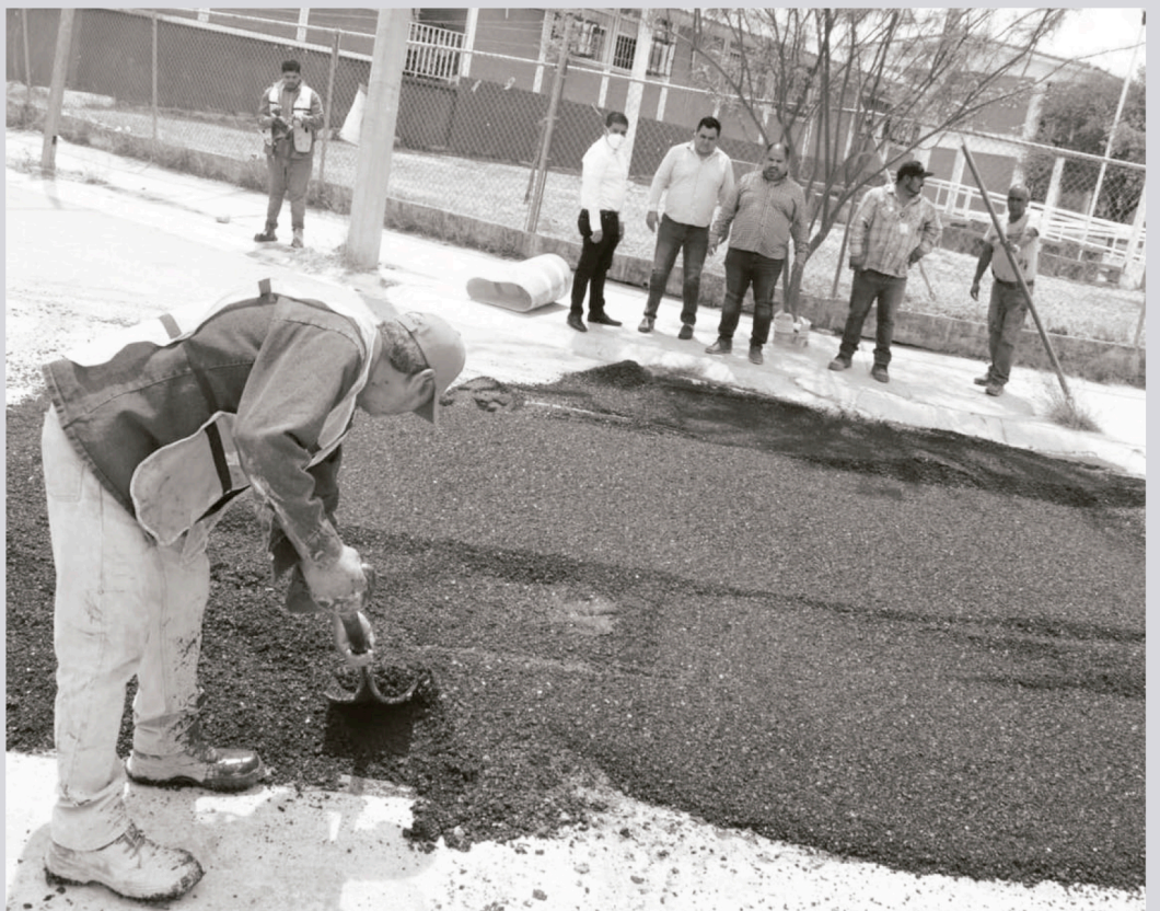
El Alcalde supervisando los trabajos de bacheo.

“Acudimos a supervisar los avances en la obra de construcción de la delegación de policía de la zona sur, que dará servicio a Santa Mónica, Pedregal, Jardines de la Silla, Arcadia Valle Real entre otras”, concluyó.